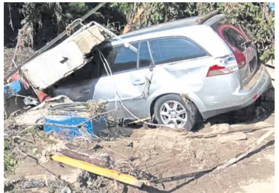
Una imagen reciente de las consecuencias de la inundación en Alemania.

Las autoridades holandesas habían cerrado una esclusa en el Rur a causa de la crecida, y de repente hubo acusaciones de Alemania de que esto había provocado la rotura de la represa que inundó la región. Sin embargo, según cálculos de la Asociación de Diques de Limburgo, no habría ninguna relación, y el Alcalde intenta visiblemente calmar las aguas: “Los holandeses protegen sus ciudades lo mejor que pueden, y yo habría hecho lo mismo en esa situación. Mantenemos una vecindad muy amistosa aquí en la zona fronteriza, no es el momento de recriminaciones”.