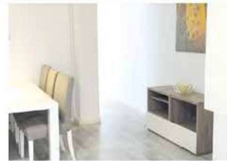
Piso La Cañada 115.000€