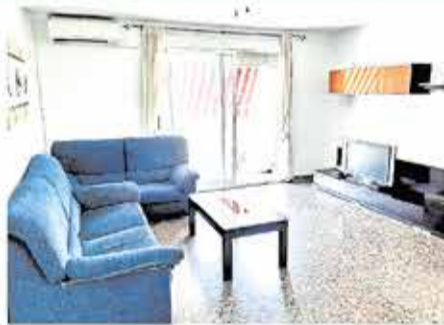
Piso La Cañada 125.000€