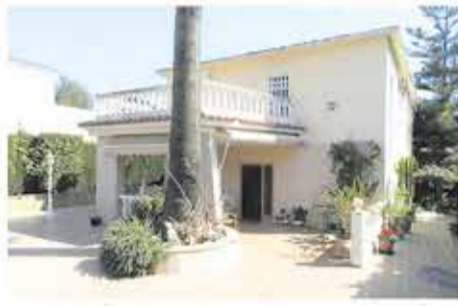
Alquiler larga estancia 1.300€