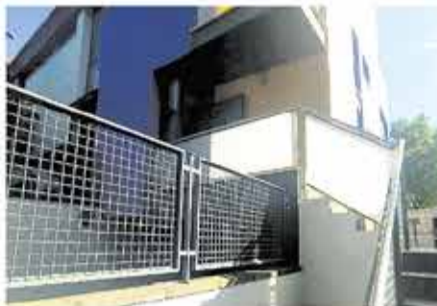
La Cañada 255.000€