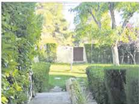
El Plantío 275.000€