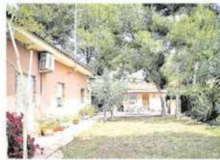
El Plantío 360.000€