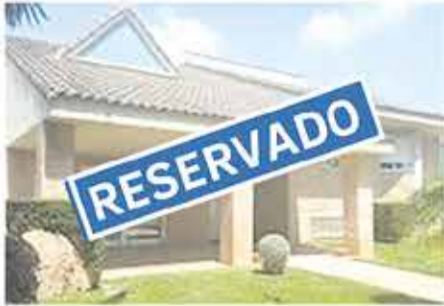
El Plantío 740.000€