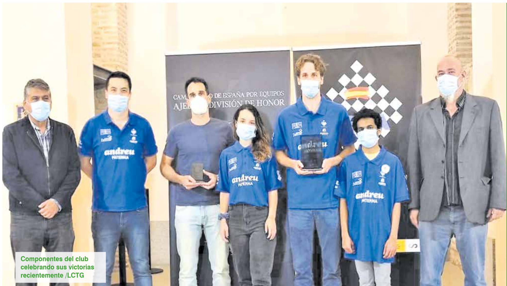
Componentes del club celebrando sus victorias recientemente

Con un nivel ELO de 2700 puntos, 5 veces Campeón de España, y entre sus logros pasados está el haber sido Campeón Mundial juvenil sub-18, Medalla de Oro en el Campeonato del Mundo por equipos, subcampeón mundial en dos ocasiones, etc. Además, se ha enfrentado a la mayoría de ajedrecistas de primer nivel mundial, saliendo victorioso en varias ocasiones en sus enfrentamientos ante jugadores como Karpov, Anand o Carlsen.